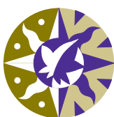
ALTERS- UND PFLEGEHEIM ZUM PARK